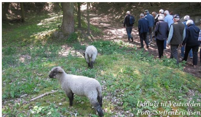
Udflugt til Vestvolden

Du er også velkommen til at besøge Stenløse Lokalarkiv, i samme bygning som Ganløse Bibliotek. Det er gratis, se oplysninger på internettet.