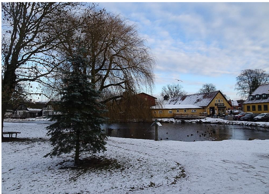
En vinterdag ved Ganløse Gadekær