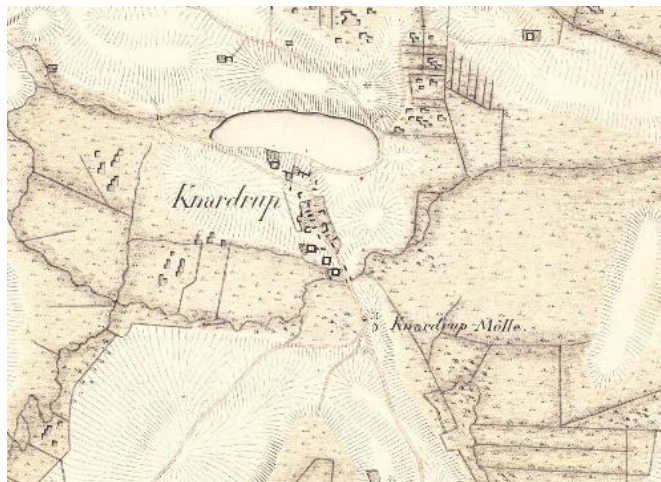
Kort over Knardrup, 1822.

Knardrup er i dag en mindre landsby, men har ikke desto mindre haft en spændende og dramatisk fortid.