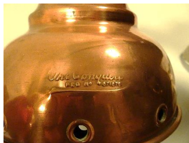
Inskription på siden