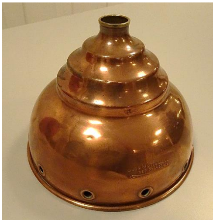
I hullet foroven, har siddet en træstok

En læser i Ølstykke har købt denne fine kobberting på et loppemarked. Hun oplyser, at der har været en træstok i toppen. Ejeren kender ikke tingens alder eller anvendelse, men købte den kun, fordi den evt. kunne bruges i forbindelse med et kobberbryllup.