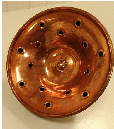
Tingen set nedefra