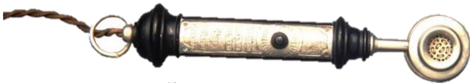
Kong Christian IX's elektriske cigartænder

Tak til vores læser for oplysningerne og foto.