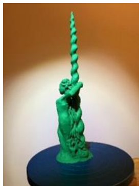
Enhjørningen i Ganløse skovene

Projektet har været i udbud, og de tre første værker er udvalgt blandt 12 indsendte værker.