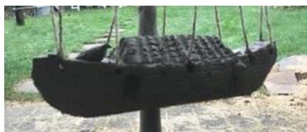
Snedkeren ved Bastrup Sø

Historierne skal ikke fortælles her. De skal opleves, men lad mig blot for at øge nysgerrigheden fortælle, at Baronen sidder på en fem meter lang drage. Dragen og Baronen udformes af træ udelukkende med motorsav. Der skal bruges et træ med en diameter på 60-70 cm - et helt træ.