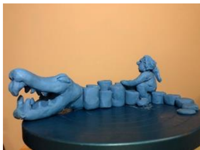
Baronen ved Buresø