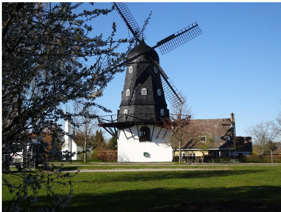
Ganløse Mølle i forårssol