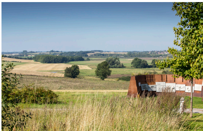
A: Fra Panoptikon ved Smørumnede kan man se udsigten over Værebros Ådal. Man kan parkere for enden af Kongeåsen.