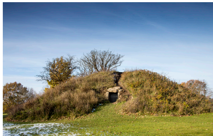
Der var tidligere gitter ved indgangen ved Stuehøj, der er nu offentlig adgang dertil.

På et grønt område i parcelhuskvarteret, tæt ved Ølstykke Station ligger jættestuen "Stuehøj" fra bondestenalderen, ca. 3.200 f. Kr.