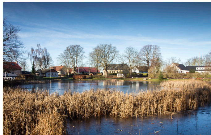
Gadekæret i Smørumovre.

Fra landsbyen Smørumovre er der en flot udsigt udover Værebros Ådal. Smørumovre er et fint eksempel på en bevaret landsby, hvor gårdene stadig ligger på deres oprindelige plads omkring det store gadekær.