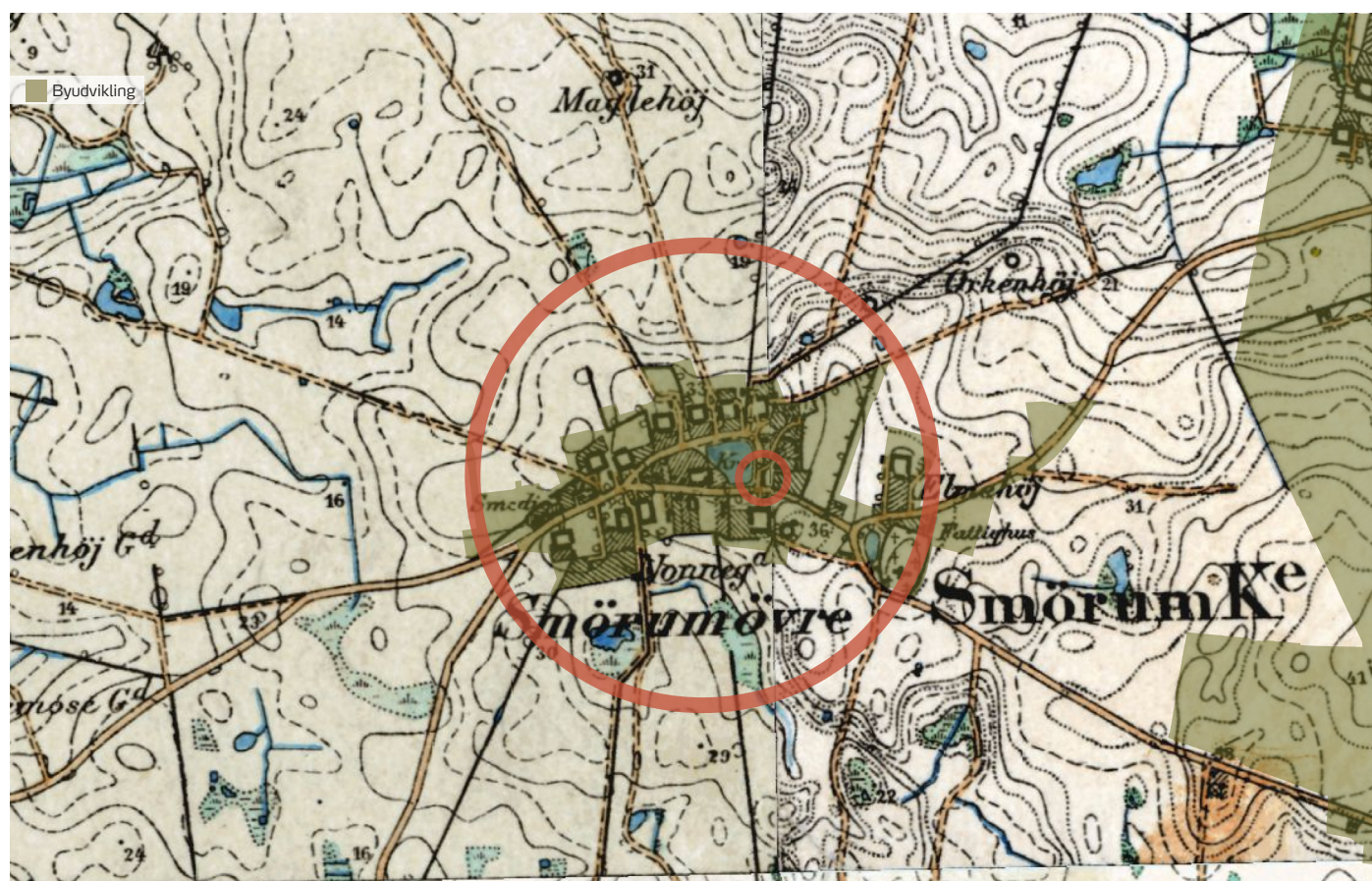
Historisk kort (1842-1899) med udpegning af Smørumovre, Smørum Gl. Skole og byudviklingen i Smørumovre.

Smørum Gl. Skole, der oprindeligt var en skole bygget af godset Edelgave for de ansattes børn, indeholder nu lokalhistorisk arkiv og museum, tidligere har skolen også været administrationsbygning for Ledøje-Smørum Kommune.