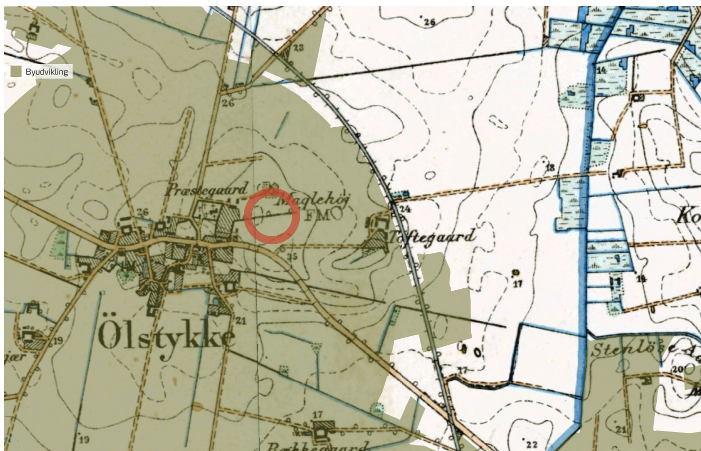
Historisk kort (1842-1899) med udpegning af Pastor Møhl Høj, Maglehøj og byudviklingen i Gl. Ølstykke.