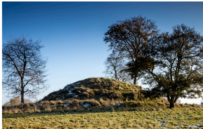
Pastor Møhl Høj, Maglehøj.

Maglehøj eller Pastor Møhls Høj ligger på et grønt område bag Ølstykke Kirke ved sognecenteret og det nye kirkegårdsanlæg.