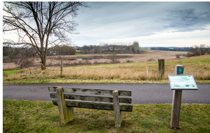
Kirkesøen kan nydes fra en bæk ved cykelstien langs Måløvej.

Ved kirkesøen i Knardrup landsby har der ligget et stort cistercienserkloster med tilhørende kirke fra 1326 til 1536. Tidligere har der på samme sted ligget en stormandsgård tilhørende hvideslægten. Klostersæsenet oplevede en række urolige år umiddelbart efter opførelsen, hvor der var stridigheder med hvideslægten.