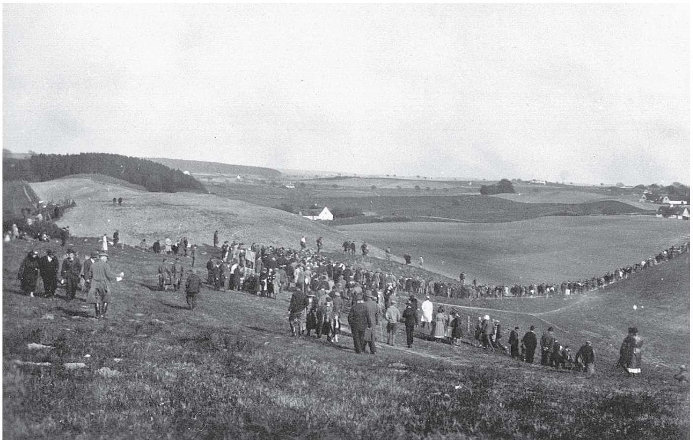
Motorbanen, da løbene tiltrak et stort publikum.