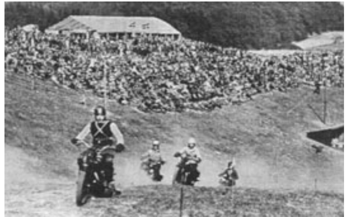
Terrænløb på motorbanen maj 1933.

Til de efterfølgende løb kom der over 6.000 besøgende, når den kendte kører Morian Hansen optrådte. Der blev