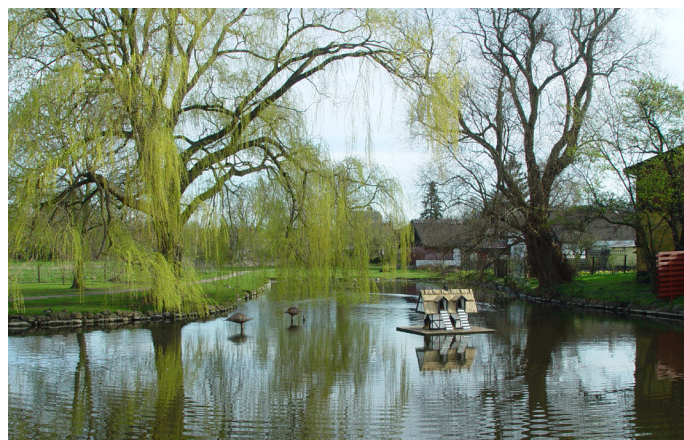
Gadekæret i Ganløse, hvor man kan se Forten i baggrunden.

Landsbyen Ganløse er et fint eksempel på en bevaret landsby med huse og gårde placeret på deres oprindelige plads omkring et åbent fællesareal "forten", tæt ved gadekæret.