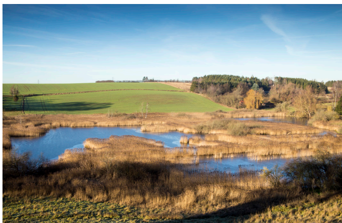
Udsigt fra kanten af Veksø udover Brøns Mose.

Brøns Mose ligger i dalen vest for Veksø. Der er en fantastisk udsigt over naturområdet fra byen. Det er stier til området både fra Veksø og fra markvejen mod vest. Det er tilladt at gå ind over engen og ned til mosen, også selv om der er græssende får - bare husk at tage hunden i snor.