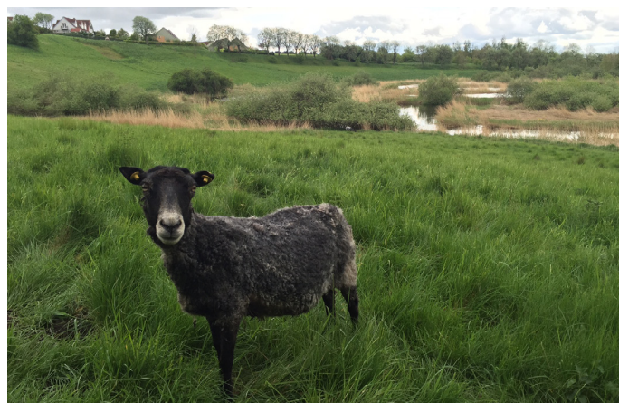
Får afgræsser engen, som en del af naturplejen.

Området omkring Brøns Mose består af overdrev, mose og sø. Overdrev kan typisk findes på tørre, lysåbne skrån-