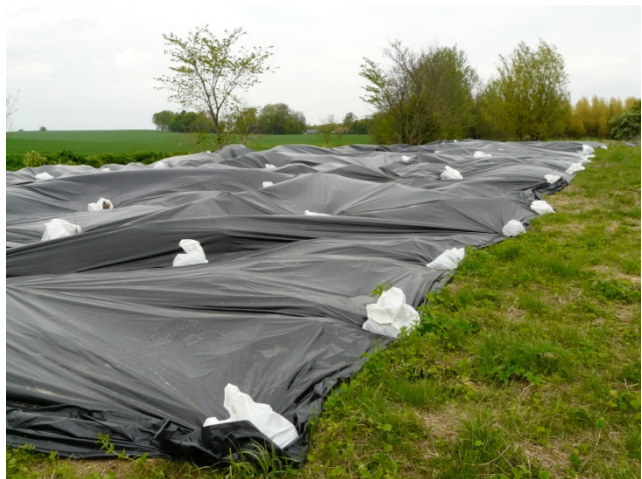
Areal ved Smørumnedre