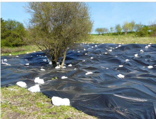
Areal ved Toppevad

Husk oprydningen og kontroller løbende arealetså der ikke dukker enkelte nye planter op.