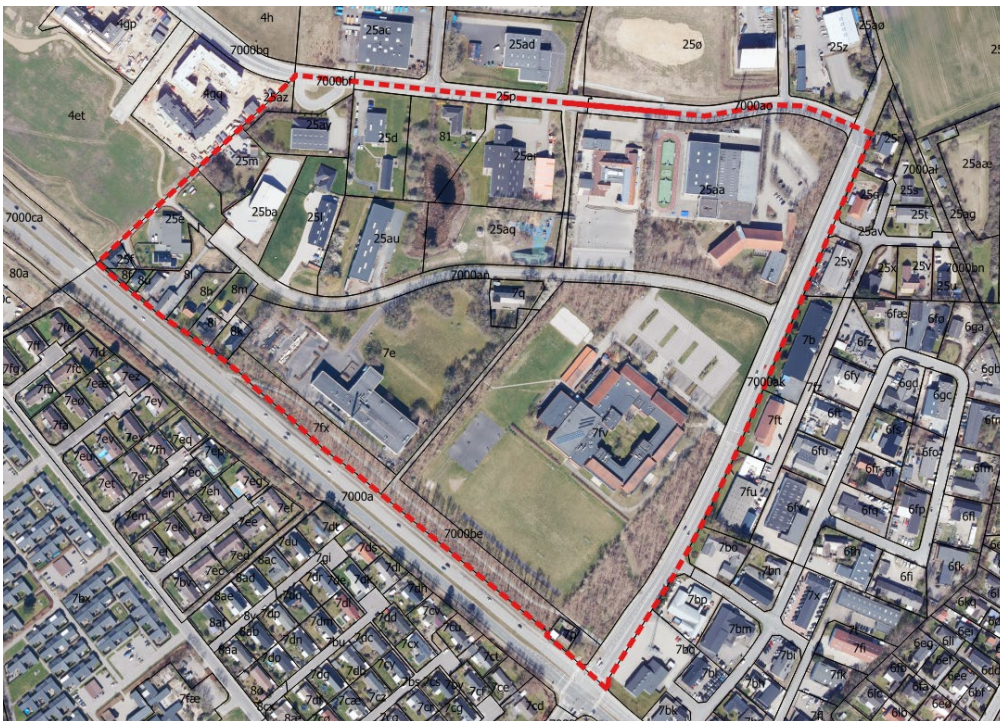
Figur 1. Maglevad Syd – nyt lokalplanområde

Lokalplanen omfatter Maglevad erhvervsområde syd for Dam Holme.