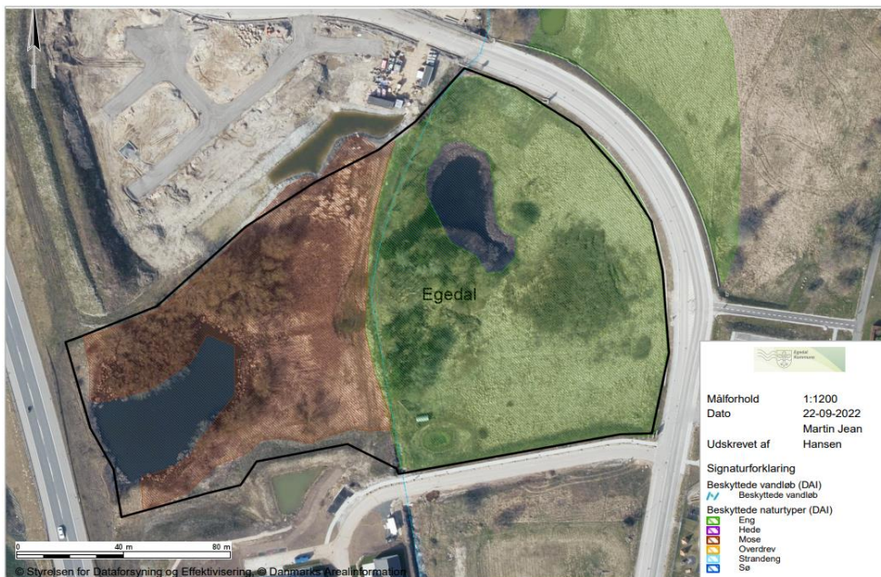
Figur 1: Oversigt over naturtyper på arealet

Arealet størrelse er sammenlagt ca. 2,34 ha