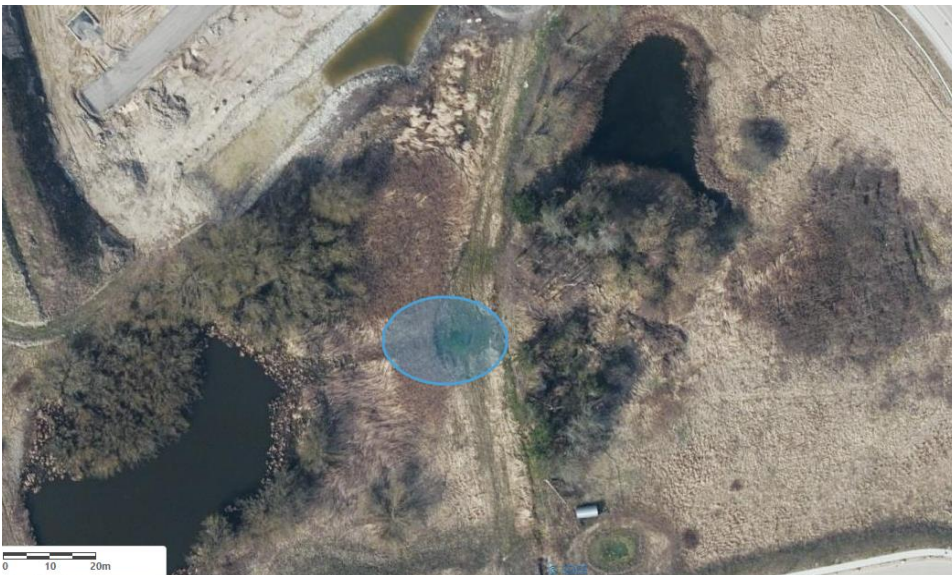
Figur 2: Lille vandhul i moseområdet markeret med blå cirkel, hvor der er fundet spidssnudet frø.

Mod nord er arealet afgrænset af nybyggeri, mod øst er den afgrænset af et vandløb, mod syd er den afgrænset af åbent områder med en støjvold og en sø, mod vest er mosen afgrænset af en motortrafikvej, hvor der her er en faunapassage.