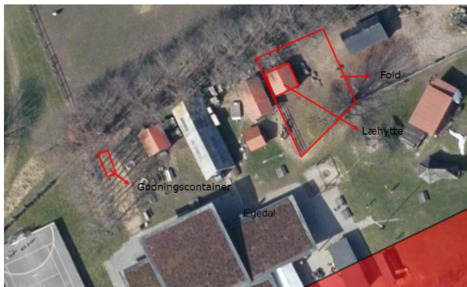
Figur 2 – Oversigt over placering af læhytte, fold og gødningscontainer.

Grisene ønskes til brug i det pædagogiske arbejde, hvor børnene lærer om pasning, pleje, omsorg og ansvar.