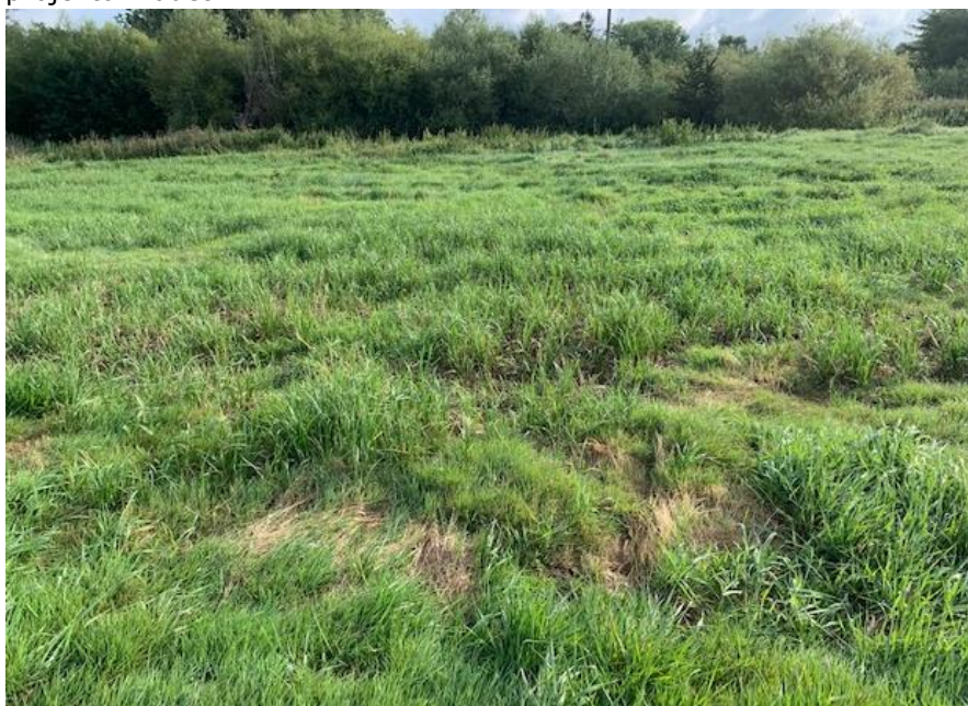
Figur 2. Engområdet set fra syd mod nord, hvor Veksørenden forløber langs pilekrattet i baggrunden. Engen er domineret af kulturgræsser og nældepartier.

Der er kendskab til bilag IV-arterne spidssnudet frø og stor vandsalamander i området, som er blevet registreret i flere vandhuller nær projektområdet.