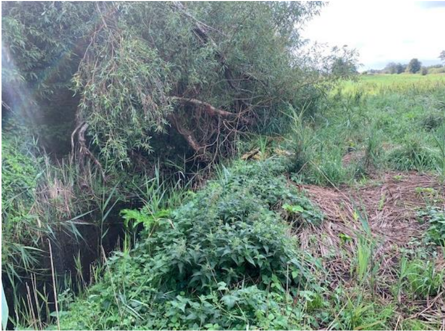
Figur 3. Veksørenden set fra vest mod øst. Området langs vandløbet er tilgroet i bl.a. stor nælde.