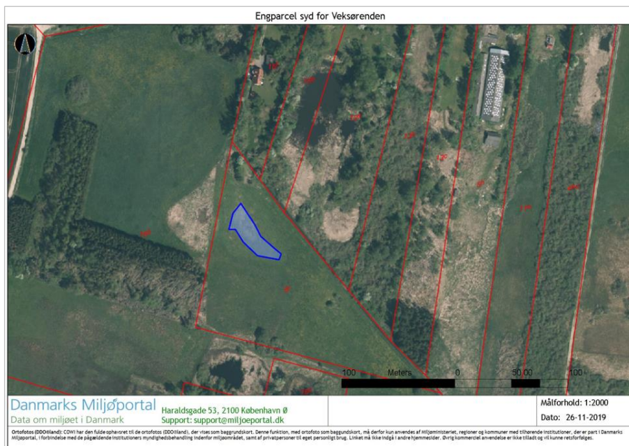
Figur 4. Området hvor det ønskes at udføre gravearbejde.